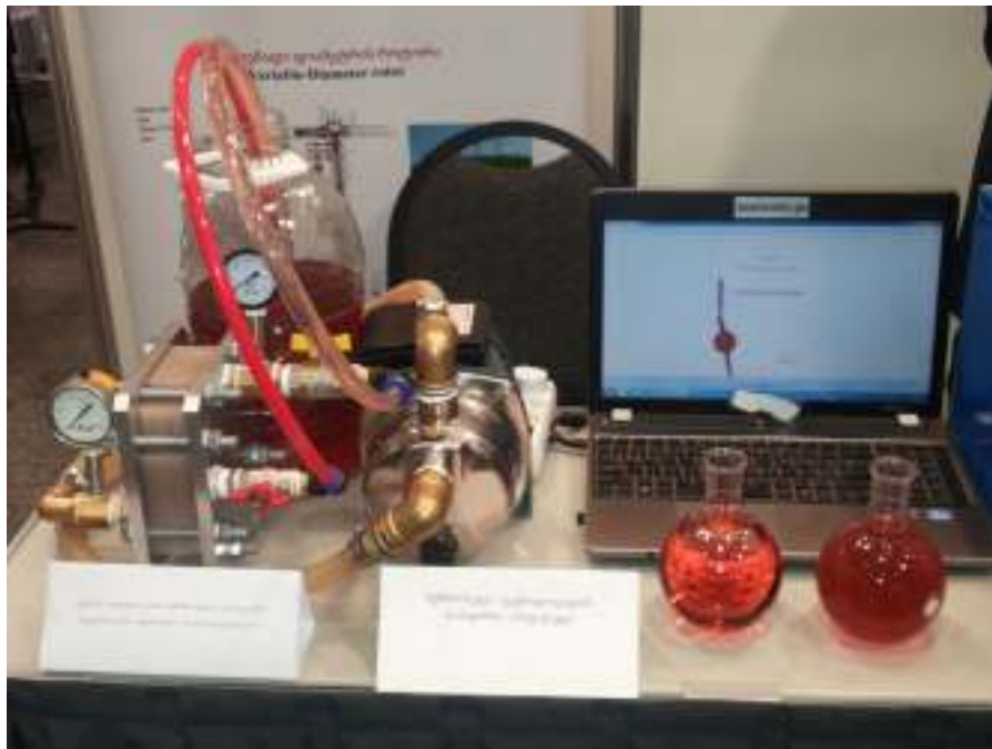
სურ.1 ღვინის სტერილური ფილტრაციის მემბრანული დანადგარი

2015 წლის 10 ნოემბერს “ექსპო ჯორჯია”-ს საგამოფენო დარბაზში საქართველოს განათლებისა და მეცნიერების სამინისტროს მიერ ჩატარებული ღონისძიების ფარგლებში მემბრანული ტექნოლოგიების საინჟინრო ინსტიტუტის მიერ მოხდა ღვინის სტერილური, ფინიშური ფილტრაციის მემბრანული დანადგარის დემონსტრაცია. სურ.-ზე 1 მარცხენა კოლბაში წარმოდგენილია გაფილტრული ღვინო, ხოლო მარჯვენაში - გაუფილტრავი. ფილტრაციის დემონსტრირება განხორციელდა გამოფენის მსვლელობისას. გაფილტრული ღვინის გამჭვირვალობის მაჩვენებელი ფორმაზინის ერთეულით შეადგენს NTU 0,32. იგი კრისტალურად გამჭვირვალეა. პირველადი მასალის გამჭვირვალობა ტოლია NTU 20,35, ხოლო კონცენტრატის – NTU 250,47.