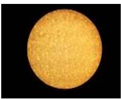
სურ.2 აცეტატცელულოზას აპკი