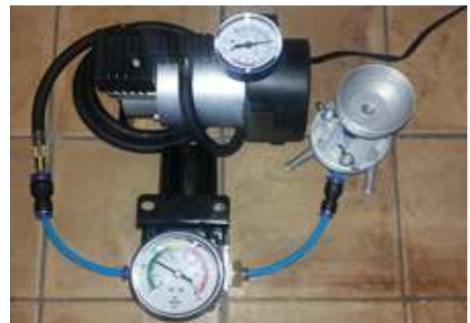
სურ.1 ფორების მზომი ხელსაწყო

ფორების მზომი ხელსაწყო შედგება: 1-უჯრედი, 2-ჭურჭელი ბუშტულაკების წარმოქმნის დასაფიქსირებლად, 3-აირის ტუმბო, 4-აირის წნევის რეგულატორი, 5-მომჭერი, 6-მანომეტრი.