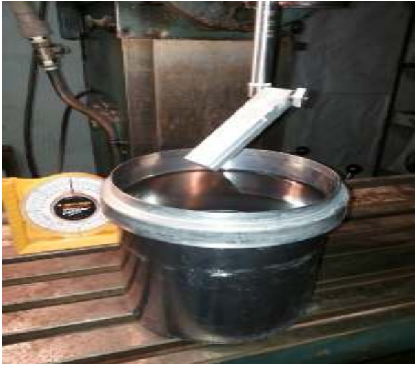
სურ.1 ფაზური ინვერსიის ხელსაწყო