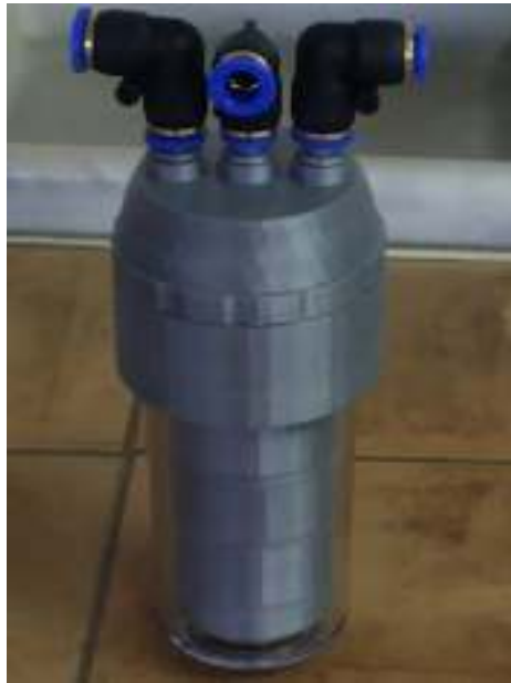
სურ.1 წყლიდან 300მკმ-დან 50მკმ-მდე ზომის ნაწილაკების შემაკავებელი ხელსაწყო

დასამუშავებელი წყლის გარანულომეტრიული შემადგენლობიდან გამომდინარე საფილტრაციო ხელსაწყო იწყობა 300-, 200-, 100- და 50მკმ-ს ზომის ნაწილაკების შემაკავებელი მკომპლექტებელი დეტალებით. წყლის სტერილური დამუშავება უზრუნველყოფილია ტანგენციალური ულტრაფილტრაციული მემბრანული დანადგარით. დამუშავებული წყლის გამჭვირვალობის მახვენებელი ფორმაზინის ერთეულით შეადგენს NTU 0,01.