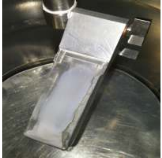
სურ. 2 ხელსაწყოზე მიღებული მემბრანა